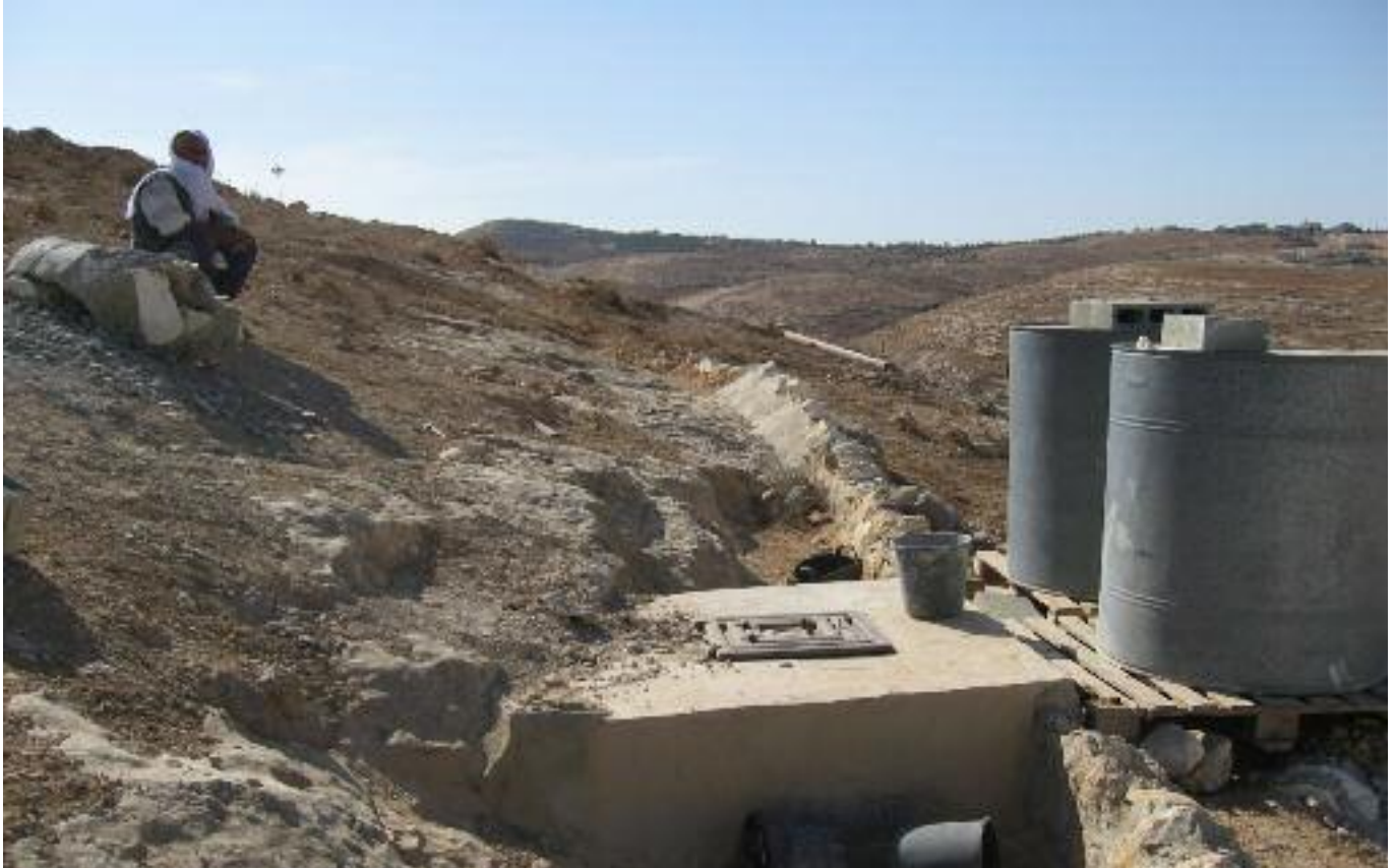
Fadhel Raba, sentado junto a una cisterna de agua que corre el riesgo de ser destruida en el pueblo de Tuwani, en los montes del sur de Hebrón. El 25 de noviembre de 2009 se ejecutó una orden de demolición dictada por las autoridades israelíes contra unas torres de alta tensión de Tuwani en julio de 2009. El ejército dictó también orden de "detener las obras" contra siete nuevas viviendas palestinas y una cisterna de agua.