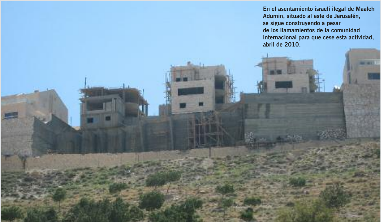
En el asentamiento israelí ilegal de Maaleh Adumin, situado al este de Jerusalén, se sigue construyendo a pesar de los llamamientos de la comunidad internacional para que cese esta actividad, abril de 2010.